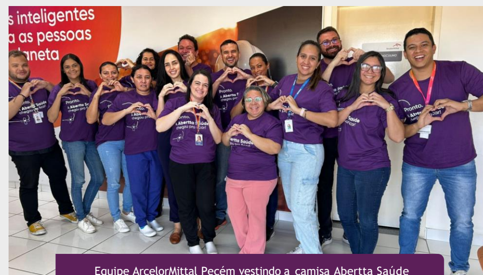
Equipe ArcelorMittal Pecém vestindo a camisa Abertta Saúde