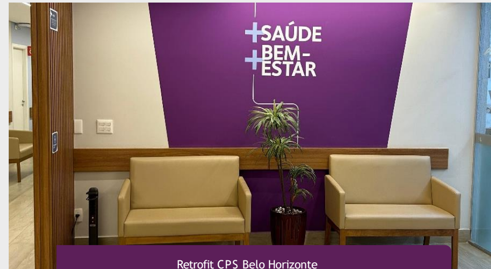
Retrofit CPS Belo Horizonte